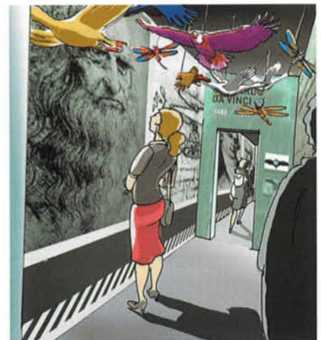
Faszination Fliegen: Noch gibt es die „Welt der Luftfahrt“ nur in Form von Skizzen

Der Eingangsbereich mit Abfertigungsschalter trägt den Namen „Check-in der Träume“. Lese- und Medienecke stimmen hier auf das Thema ein. Danach beginnt der Ausstellungsbereich. Zu Beginn wird der Besucher mit dem Leben und Wirken von Luftfahrtpionieren und Visionären vertraut gemacht: Ikarus,