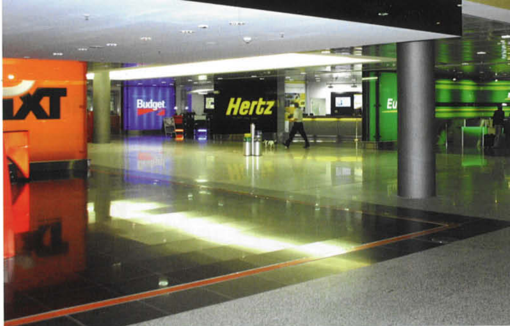
Die neue Dienstleistungszone im Hannover Airport

lator versetzt den Besucher in die Lage, die Schalter zu drücken, die auch ein Flugkapitän bedienen muss.