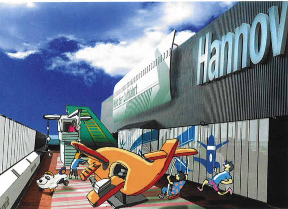
Kids Airport: Hier können Kinder „Flughafen spielen“, auch einen Mini-Tower gibt es

Zwei Millionen Euro investiert der Flughafen Hannover in die neue Attraktion „Welt der Luftfahrt – Traum vom Fliegen“. Die Ausstellungs- und Erlebniswelt soll im September eröffnen und jährlich 200.000 Besucher anziehen. Einige Ausstellungsstücke wurden sogar von einem Flugzeugfriedhof in der Mojave-Wüste nördlich von Los Angeles herangeschafft.